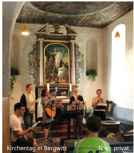
Kirchentag in Bergwitz