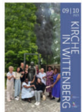
4 488 Mitteilungsblatt September / Oktober 2023