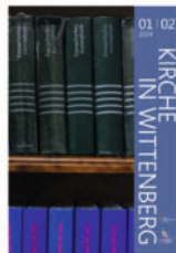
4 488 mitteilungsblatt-januar-februar 2024

Allen Spendern sei an dieser Stelle vielmals gedankt.