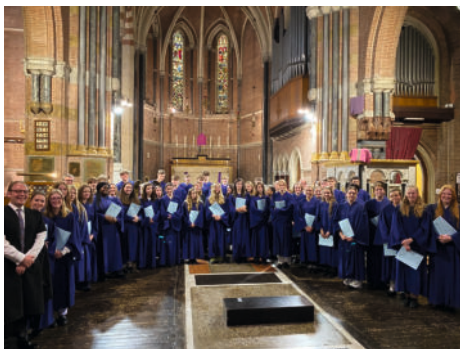
Repton Chapel Choir