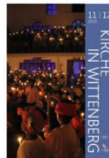
4 488 Mitteilungsblatt November / Dezember 2023