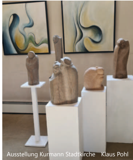
Ausstellung Kurmann Stadtkirche Klaus Pohl