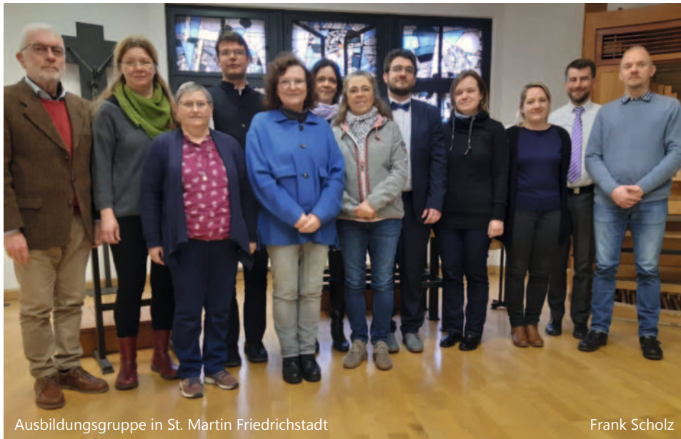
Ausbildungsgruppe in St. Martin Friedrichstadt