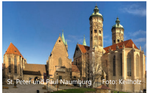
St. Peter und Paul Naumburg

Natürlich stehe ich gern für Fragen zur Ver- fügung. Als Organisator darf ich alle Inte- ressenten bitten, sich bei mir zu melden, wenn möglich bitte bis Ende Juli .